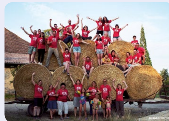
Une belle moisson ! (Action France)